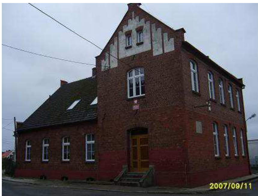
„Nasza nadzieja”: Dom Kultury Wiejskiej